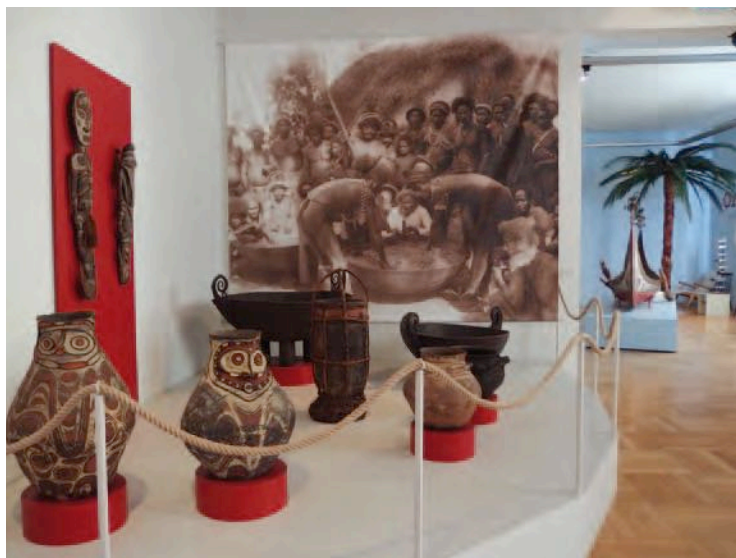
Abb. 4 a, b: Gestaltung der ständigen Ausstellungen z. B. Afrika und Ozeanien