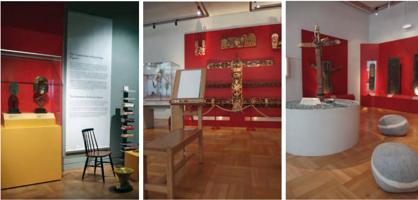
Abb. 5 a-c: Bücherecke, Staffelei und Sitzmöglichkeiten als Ausstellungselemente

finanzielle Unterstützung durch den Freistaat wurden gestellt. Durch die regionale Gliederung ist die Orientierung im Haus sehr einfach. Die ständige Ausstellung zu Afrika (2. OG) wurde im Jahr 1998 eingerichtet. Die ständigen Ausstellungen zu Nord- und Südamerika (2. OG) eröffneten im Jahr 2000 bzw. 2004. Im Jahr 2005 wurde die ständige Ausstellung zu Ozeanien, 2003 die zum Orient eröffnet (1. OG). Die Afrika- und die Orientausstellung wurden bzw. werden seit geraumer Zeit in einigen Bereichen gestalterisch verändert. In beiden Ausstellungen sind zeitgenössische Kunstwerke bereits fester Bestandteil der Präsentation, wie überhaupt das Sammeln zeitgenössischer Kunst zur Programmatik des Museums gehört.