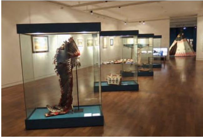
Abb. 3: Blick in die Ausstellung „Farben Kunst Indianer. Der Münchner Impressionist Julius Seyler bei den Blackfeet“