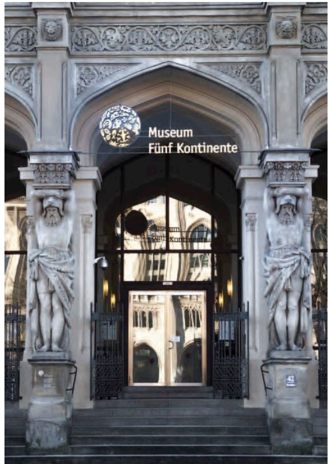
Abb. 1: Der Eingang zum Museum Fünf Kontinente mit dem neuen Logo

Hier befindet sich alles in einem Gebäude (Gesamtfläche ca. 12.500 qm): die Sammlungsdepots und das Archiv, die ständigen und die Sonderausstellungen, die Büro- und Verwal-