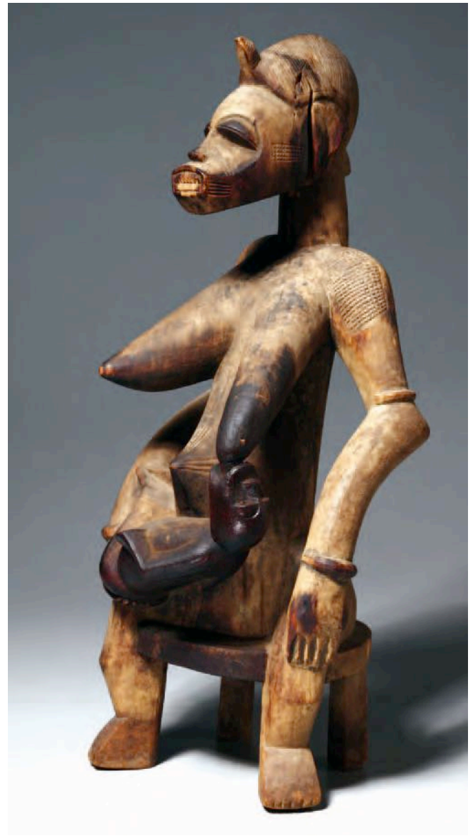
Abb. 5: Mutter-Kind-Figur, H. 63, 6 cm, The Cleveland Museum of Art, Nr. 1961.198, James Albert and Mary Gardiner Ford Memorial Fund

Der Kunstmarkt ist, wie das Wort sagt, ein Markt mit finanziellen Interessen. Dies stellt kein Problem dar, und das Auswahlresultat ist aus unserer persönlichen ästhetischen Sicht mehr als befriedigend. Einen schwerwiegenden Fehler dieser Auswahl stellt jedoch der Umstand dar, dass fast das gesamte Kunstschaffen der Senufo in den letzten 50 bis 80 Jahren ausgeblendet wurde. Das im Katalog sogenannte „Mapping Senufo“ endet irgendwann zwischen 1930 und 1950, die ausgestellten Skulpturen erscheinen zeitlos „um 1900“. Das passt