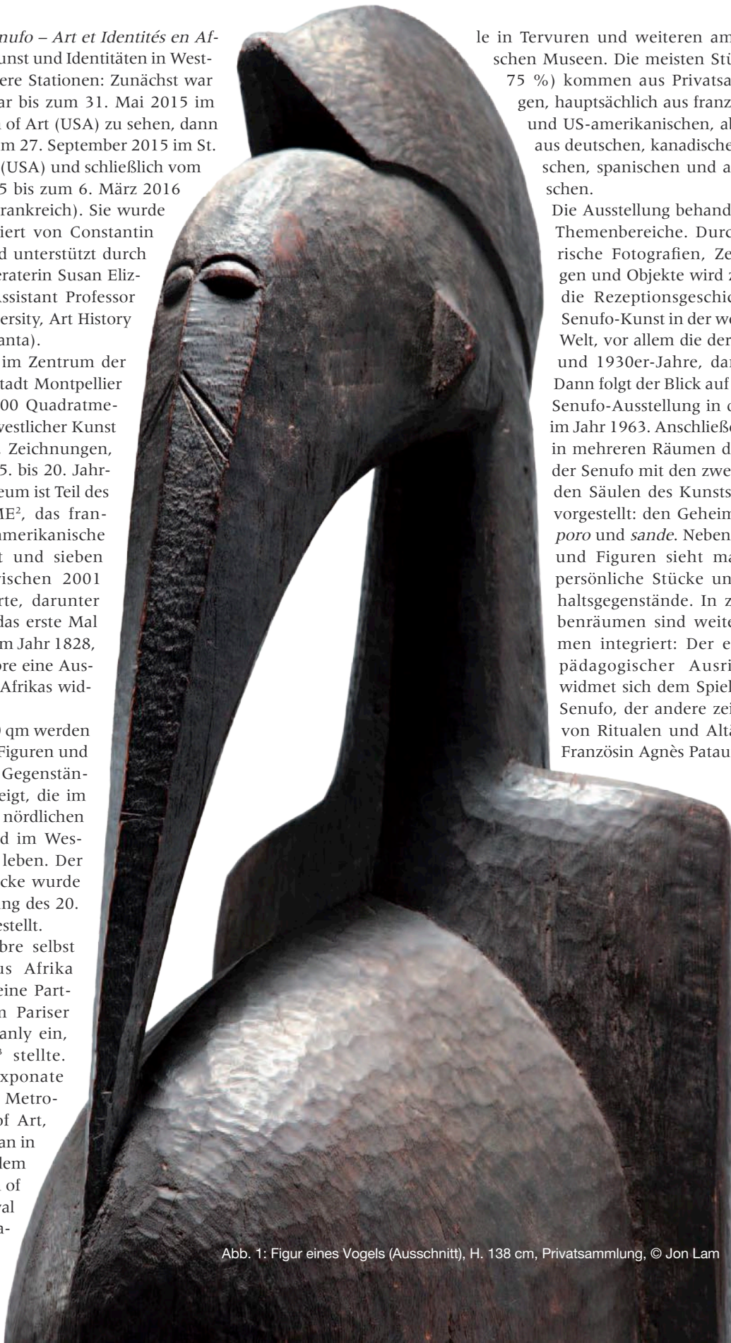
Abb. 1: Figur eines Vogels (Ausschnitt), H. 138 cm, Privatsammlung, © Jon Lam

Die Ausstellung behandelt sechs Themenbereiche. Durch historische Fotografien, Zeichnungen und Objekte wird zunächst die Rezeptionsgeschichte der Senufo-Kunst in der westlichen Welt, vor allem die der 1920er- und 1930er-Jahre, dargestellt. Dann folgt der Blick auf die erste Senufo-Ausstellung in den USA im Jahr 1963. Anschließend wird in mehreren Räumen die Kunst der Senufo mit den zwei tragenden Säulen des Kunstschaffens vorgestellt: den Geheimbünden poro und sande . Neben Masken und Figuren sieht man auch persönliche Stücke und Haushaltsgegenstände. In zwei Nebenräumen sind weitere Themen integriert: Der eine, mit pädagogischer Ausrichtung, widmet sich dem Spiel bei den Senufo, der andere zeigt Fotos von Ritualen und Altären der Französin Agnès Pataux.