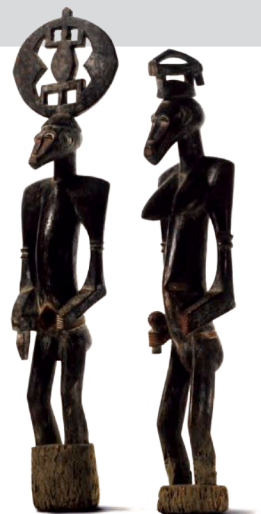
Abb. 3: Figurenpaar der Senufo, H. 115 cm und 97 cm, Privatsammlung, Courtesy McClain Gallery, © Sotheby's

Ausgestellt sind weiterhin vier Bücher mit ersten Erwähnungen und Abbildungen von Senufo-Objekten: Du Niger au Golfe de Guinée par le pays de Kong et le Mossi 1887 bis 1889 von Louis Binger, Negerplastik von Carl Einstein (1918) und Primitive Negro Sculpture von Paul Guillaume und Thomas Munro (1926). Eine erste Klassifikation eines Senufo-Stiles findet sich bei Carl Kjerfve in Centres de style de la sculpture nègre africaine (1935). Zu sehen sind auch Fotos von Senufo-Figuren von Man Ray und Walker Evans aus den 1930er-Jahren sowie eine Gouache mit dem Titel Création du Monde von Fernand Léger (1923), einer Darstellung von Senufo-Figuren.